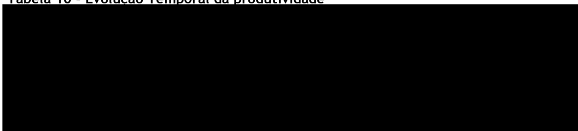
Tabela 10 - Evolução Temporal da produtividade

A tabela abaixo mostra a evolução temporal dos níveis de produtividade de principais culturas da 1ª época.